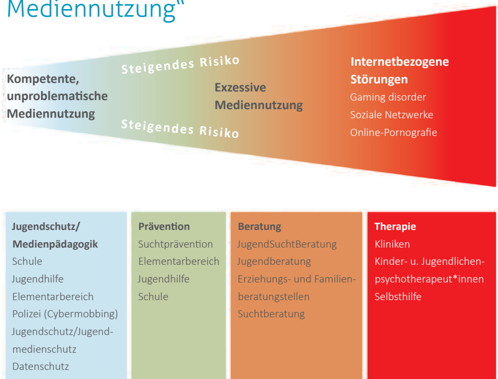
Abbildung 1: Arbeitsfelder im Kontext „exzessiver Mediennutzung“