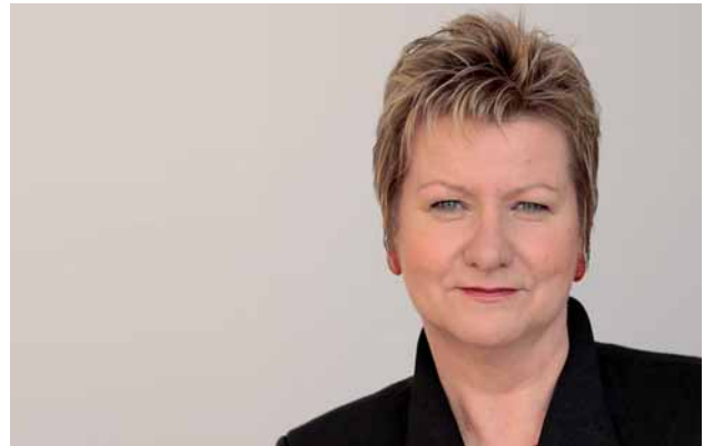
Sylvia Löhrmann, Ministerin für Schule und Weiterbildung

Ziel der Überarbeitung war es, die Ausbildung im Vorbereitungsdienst unter dem Blickwinkel »Lernen und Lehren in einer Schule der Vielfalt« mit einem weiten Inklusionsbegriff zu stärken. Die wohl sichtbarste Veränderung in der Umsetzung dieser Anforderung stellt die Neuausrichtung des bisherigen Handlungsfeldes 5 »Vielfalt...« hin zu einer allen Handlungsfeldern unterlegten Leitlinie »Vielfalt als Herausforderung annehmen und als Chance nutzen« dar. Damit wird der wegweisende Paradigmenwechsel in der schulpraktischen Ausbildung konsequent verankert. Die Gleichwertigkeit der weiteren Handlungsfelder wird durch ihre jeweils neuen Bezeichnungen unterstrichen, und die zentralen Querschnittsthemen erfordern deren enge Vernetzung, was sich in den exemplarischen Handlungssituationen und Erschließungsfragen abbildet. Die Querschnittsthemen sind integraler Bestandteil der Ausbildung in allen Fächern und